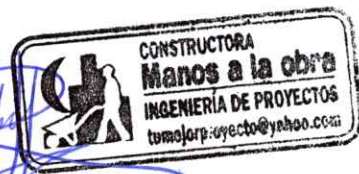
FEDEDMAN FEIDER CALDERÓN RODAS CONTRATISTA