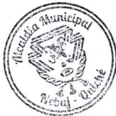
FEEDMAN FEIDER CALDERÓN RODAS CONTRATISTA