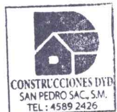
DARVIN DUERTY NAVARRO DE LEÓN CONTRATISTA