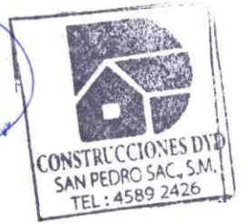
DARVIN DUERTY NAVARRO DE LEÓN CONTRATISTA